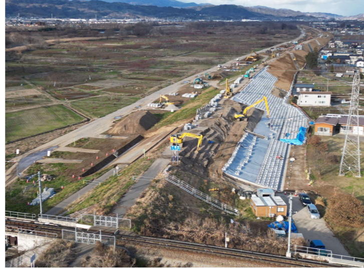
【12月工事状況】（中河原樋管側より上流方向を望む）